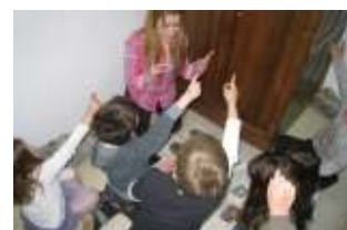
Το εργαστήριο των ορυκτών

Στο εργαστήριο θα πειραματιστούν με τις ιδιότητες των κρυστάλλων, ενώ με τη ζωγραφική θα βιώσουν το θαυμάσιο κόσμο των χρωμάτων των ορυκτών.