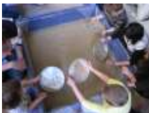
Οι μικροί χρυσοθήρες

Τέλος, σαν μικροί χρυσοθήρες, θα νοιώσουν τον πυρετό του χρυσού ψάχνοντας στην άμμο για να βρουν τους κρυστάλλους που θα πάρουν μαζί τους.